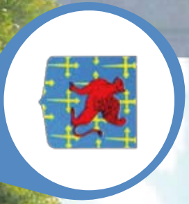
Classes en 4